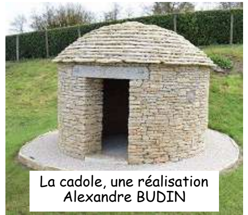
La cadole, une réalisation Alexandre BUDIN

71490 DRACY les COUCHES Fixes : 03 85 45 56 88 - 03 85 49 68 87 Potable : 06 66 93 08 66